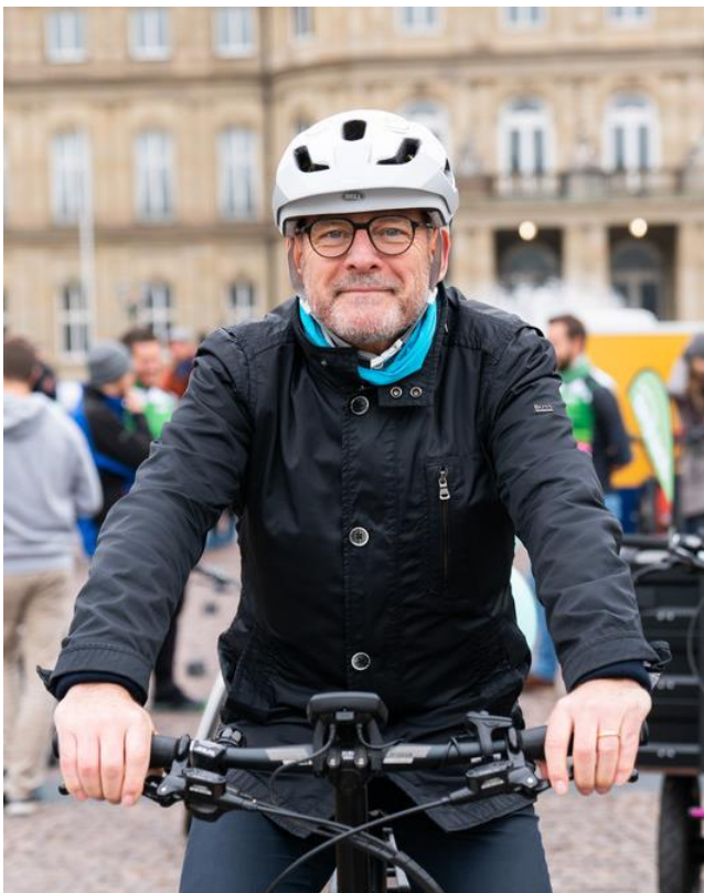
Verkehrsminister Winfried Hermann beim Radeln im Herbst (Bild aus 2019).